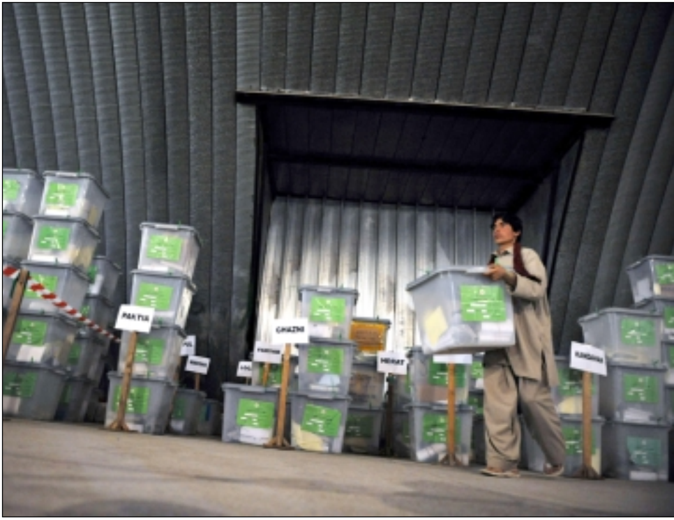
موظف يحمل أحد صناديق الاقتراع التي تم حذفها بسبب التزوير.

قرضاي ستخضع الى ما دون الـ ٥٠٪ الضرورية للفوز من الدورة الاولى، وستكون هناك حاجة الى دورة ثانية بين حميد كرزاي والمرشح الذي حل في المرتبة الثانية عبدالله عبدالله.