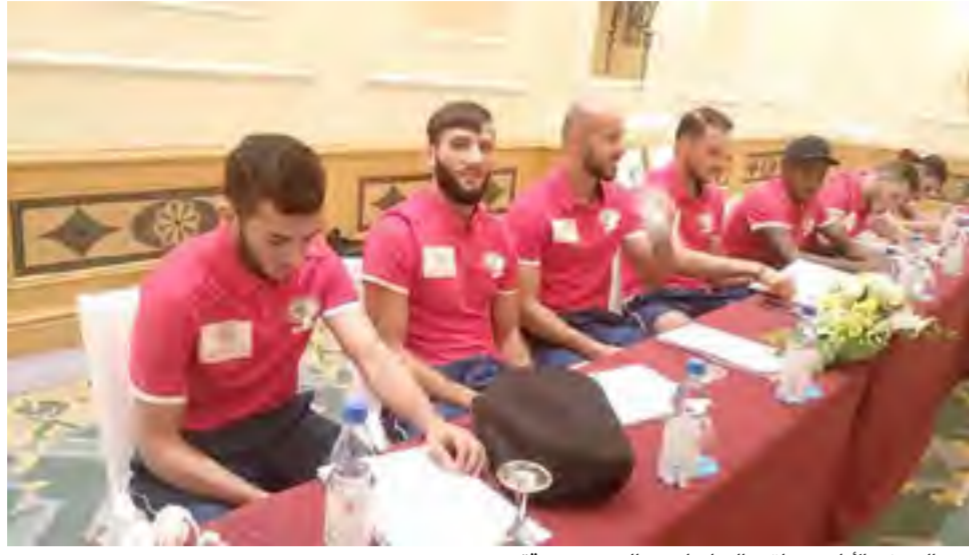
لاعب المنتخب الأولمبي يتلقون التعليمات من المدرب صندوقة.

استأنف المنتخب الأولمبي، تدريباته استعداداً لدور الـ ١٦ من دورة الألعاب الآسيوية، المقامة حالياً في جاكارتا، حيث أعلنت اللجنة المنظمة لفعاليات الدور القادم ستقام يومي ٢٣ و٢٤ الجاري. وكان المنتخب الأولمبي الفلسطيني، أول المنتخب التي تنهي مبارياتها في الدور الأول "دوري المجموعات" برصيد ٨ نقاط، من انتصارتين وتعادلين، حيث ضمن الأهل بشكل رسمي للدور الثاني، بانتظار الترتيب النهائي للمجموعة بناءً على ما يمكن أن تسفر عنه مباريات اليوم الاثنين، حيث تلعب هونغ كونغ الثانية برصيد ٧ نقاط، مع أندونيسيا الثالثة برصيد ٦ نقاط.