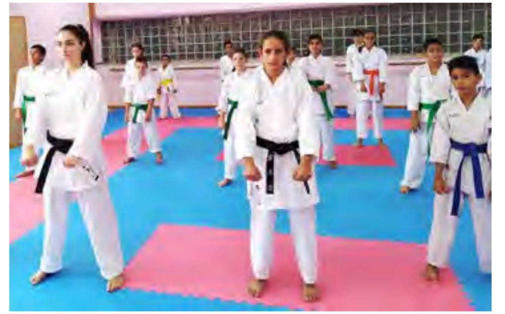
جانب من فعاليات المعسكر.

على رياضة الجودو الاولمبية. وشارك الهلال الاحمر الفلسطيني بمحاضرات توعوية وتثقيفية للإسعاف الأولي، حيث كان عدد المشاركين ٢٥ مشاركاً ومشاركة. وفي ختام المعسكر أقيمت بطولة تنشيطية للمشاركين وزعت الميداليات على المشاركين.