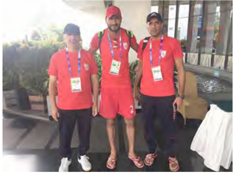
منتخب فلسطين لكرة الطائرة الشاطئية.

جاكارتا - الموعد الإعلامي: وصل منتخب فلسطين لكرة الطائرة الشاطئية إلى مدينة بالبانغ شمال جزيرة سومطرة في إندونيسيا للمشاركة في منافسات اللعبة ضمن بطولة الألعاب الأولمبية الآسيوية التي تستضيفها مدينة جاكارتا وبالبانغ حتى الثاني من أيلول المقبل.