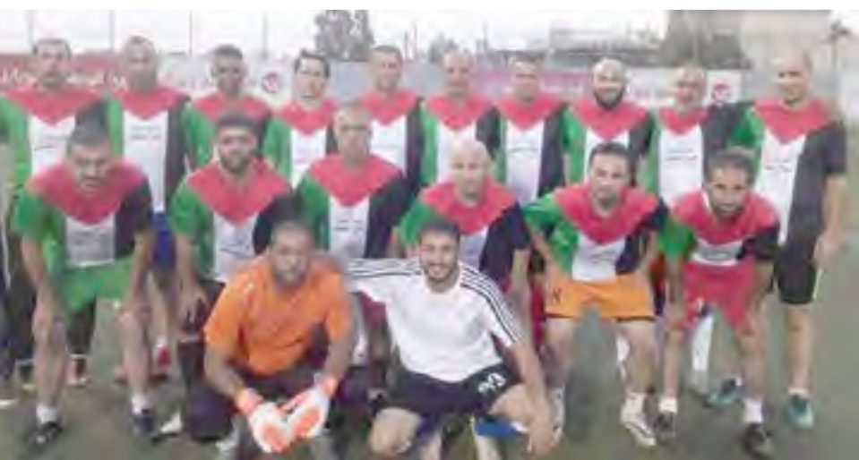
منتخب قدامى رام الله والبيرة.