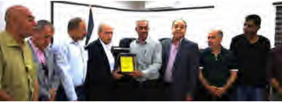
جانب من حفل التكريم.