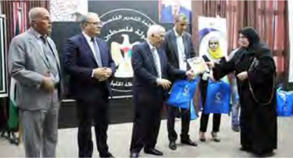
جانب من حفل التكريم.

الثلاثين - الأيام : أقيم في مقر محافظة الخليل، أمس، حفل تكريم الناجحين في امتحانات الثانوية العامة "الإنجاز" للعام ٢٠١٨ من ذوي الإعاقة برعاية المحافظ كامل حميد ووزير التوظيف الاجتماعي د. إبراهيم الشاعر، وبحضور ذوي الطلبة والمؤسسات الرسمية والأهلية وعدد من الشخصيات الاعتبارية. وبلغ عدد الطلبة الناجحين لهذا العام ٣٠ طالباً وطالبة من كافة التخصصات. ويأتي التكريم، بحسب بيان صدر عن دار المحافظة، أمس، في إطار التأكيد على أهمية هذه الفئة المهمة من المجتمع ودورها البناء في التطور العلمي والإنجازات التي تحققت خلال الفترة الماضية، ويقام التكريم بشكل منتظم وسنوي. وهنا حميد في كلمته باسم الرئيس والقيادة الفلسطينية، هذه الفئة من الطلبة مشيراً إلى أن الرئيس يولي هذه الفئة أولوية وأهمية خاصة، مشدداً على أننا لن نبخل على هذه الفئة ولن نسجم أن يكون الفقر والعوز سبباً في منع أي طالب من الذهاب إلى مقاعد الدراسة، معبرا عن فخره بهذه الفئة، مؤكداً الالتزام بالوقوف إلى جانبهم من جهته قال الشاعر: تكرم اليوم كوكبة من الناجحين من ذوي الاعاقة اصحاب المهنم والارادة رغم كل الصعوبات التي تواجههم، مستعرضاً أهم الخدمات التي تقدمها الوزارة خصوصاً لذوي الاعاقة والتي كان اخرها القانون الجديد الذي يخدم مصالح هذه الفئة اضافة الى انشاء قاعدة بيانات تشملههم وتتضمن الاعاقات التي يعانون منها، وخصمت الوزارة موازنة خاصة لشراء الاجهزة المساندة لهم وتساعدهم على الاندماج في المجتمع وعجلة التنمية المستدامة.