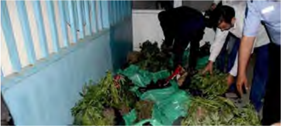
عينة من المضبوطات.

رام الله - "الأيام": ضبطت الشرطة، أمس، مئات الأشتال الخضراء من مادة القنب الهندي المخدرة "المارغوانا"، وألقت القبض على ٥ أشخاص في بلدة غرب محافظة رام الله والبيرة.